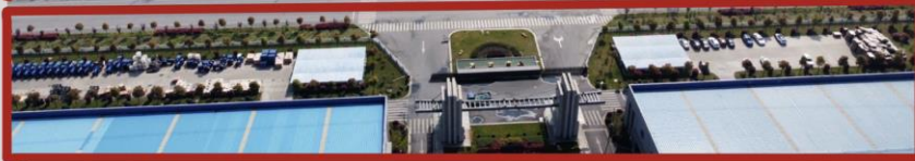
사용 중 양주 공장