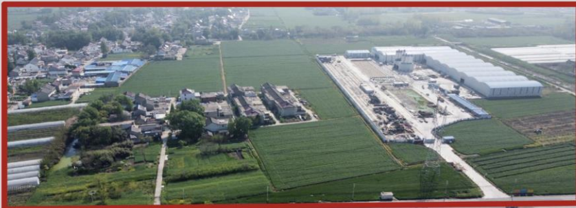
공장시설 투자 부지